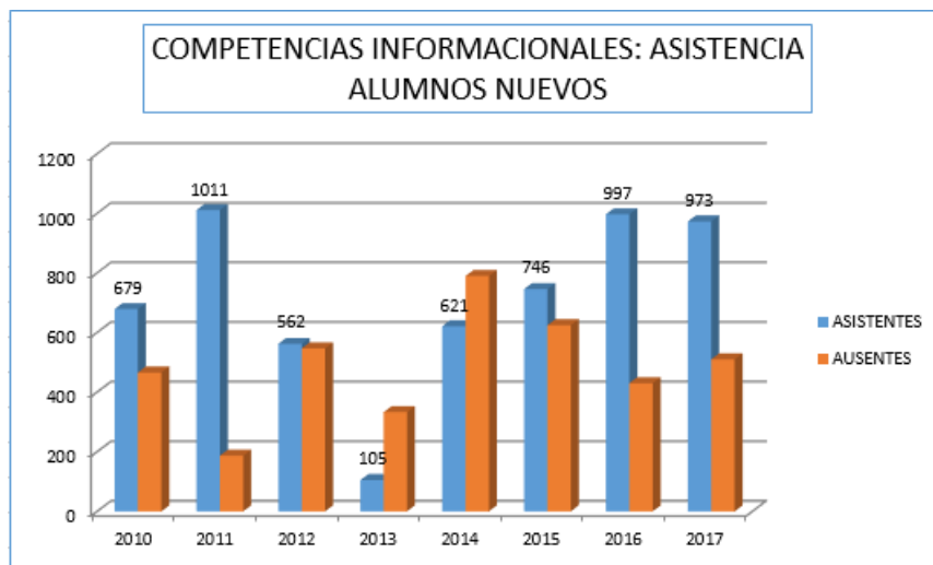
Gráfico N° 1: Crecimiento general de alumnos capacitados por año.

En el siguiente gráfico, podemos observar el crecimiento general por año de la cantidad de alumnos de primer año capacitados en ALFIN.