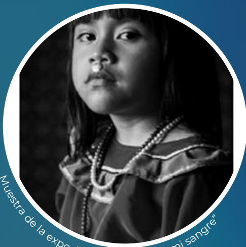
Muestra de la exposición "Retratos de mi sangre"