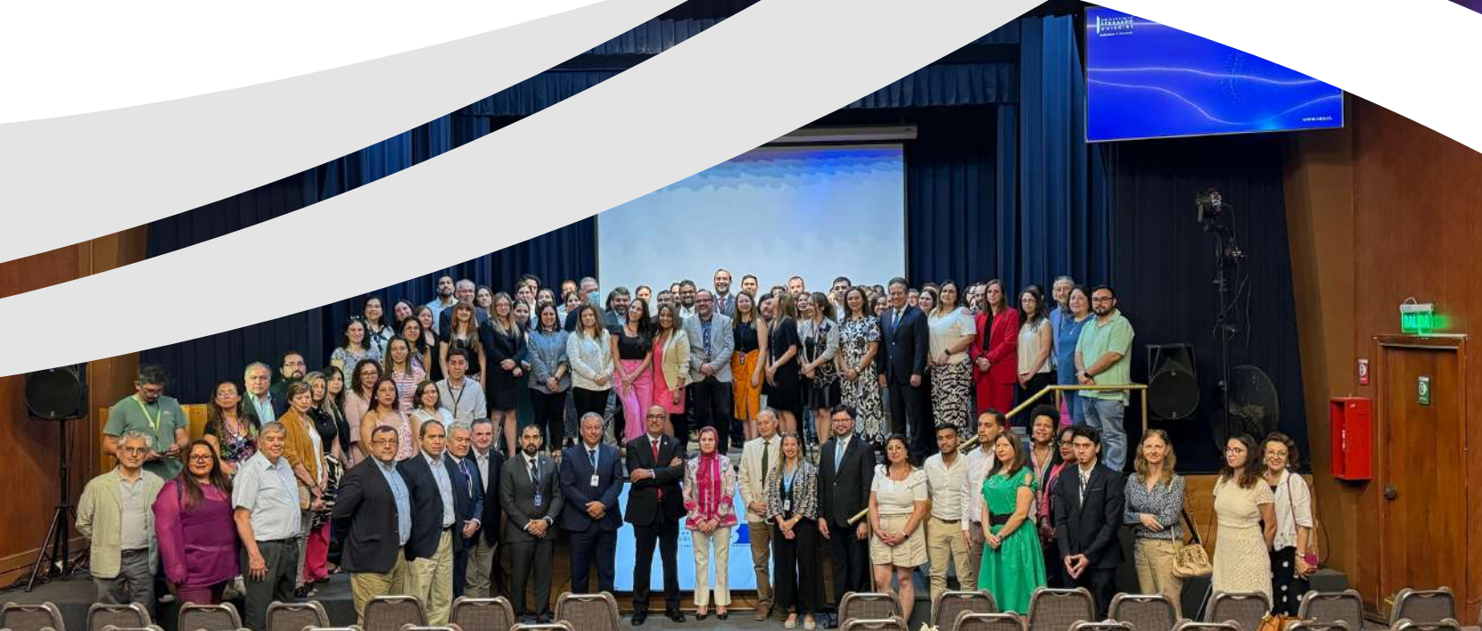
Foto oficial de socios estratégicos de la VCM junto a autoridades universitarias, decanos y decanas y directivos UBO