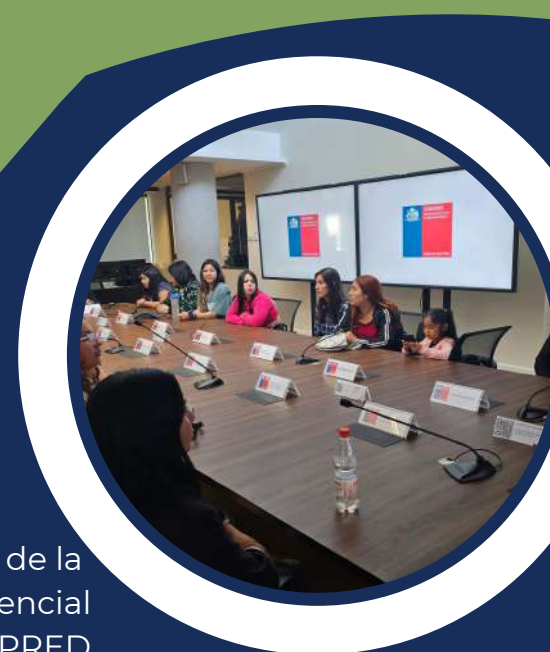
Mesa de trabajo de la Escuela de Educación Diferencial con SENAPRED

Coordinadora del programa vcm de la carrera Ingeniería Comercial