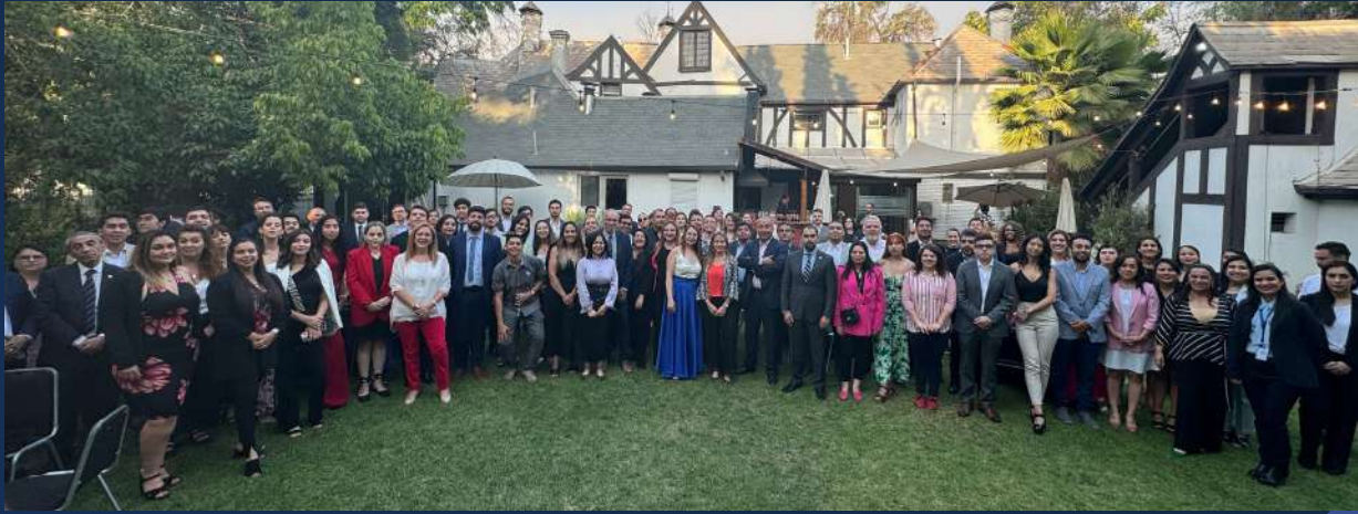
Fotografía oficial de titulados y tituladas, autoridades universitarias, decanos y decanas y directivos de escuela junto con el equipo de la Dirección de Empleabilidad y Alumni.

El 24 de enero, se realizó la Gala Anual de egresados y egresadas UBO organizada por la Dirección de Empleabilidad y Alumni.