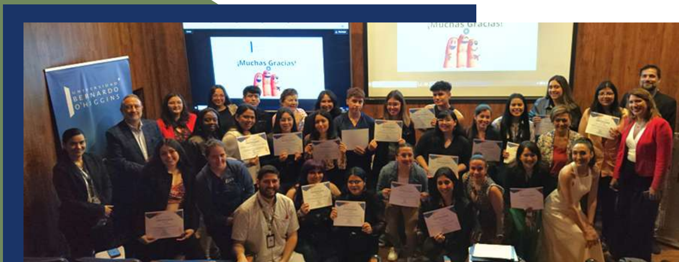
Mesa del Programa de Vinculación con el Medio de la Escuela de Enfermería

Durante los meses de diciembre 2023 y enero 2024, la Dirección de Programas de VCM generó el levantamiento de más de 20 mesas colaborativas para medir el impacto cualitativo del desarrollo de los programas de Vinculación con el Medio en ejecución a lo largo del año 2023 y que representan el trabajo y participación de todas las escuelas de la UBO.