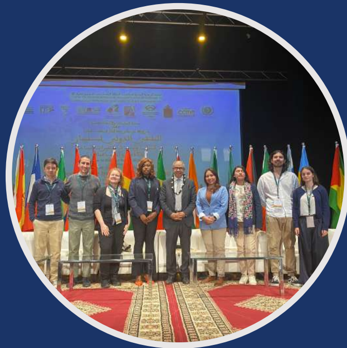
Foto Oficial del Encuentro Mundial con estudiantes UBO.