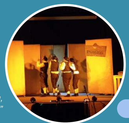
Obra teatral en escena, "Verde y Musgoso"

En el evento se mostró un video en el que se indicaron de manera pedagógica las características del modelo de Vinculación con el Medio (propuesta 2023), posteriormente se presentó la obra teatral Verde y Musgoso de la compañía Kalen Cía Teatral, en la que se daba cuenta de la importancia de la comunicación, la colaboración y la valoración de las instancias próximas y sencillas de la vida cotidiana.